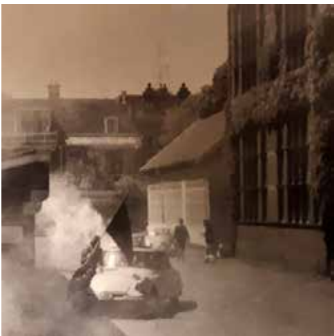
Experimenteren met rookbommen (6de klas) op de binnenplaats