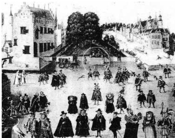
Anoniem 1596, Haags Historisch museum. Bij de muur voor de Lange Vijverberg staat het schavot waarop misdadigers en ketters werden geëxecuteerd.