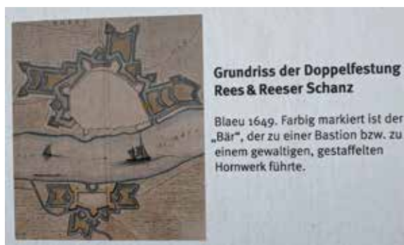
Plattegrond van Rees en de Reeser Schanz, aan de overkant van de Rijn, met de Nederlandse vestingwerken.