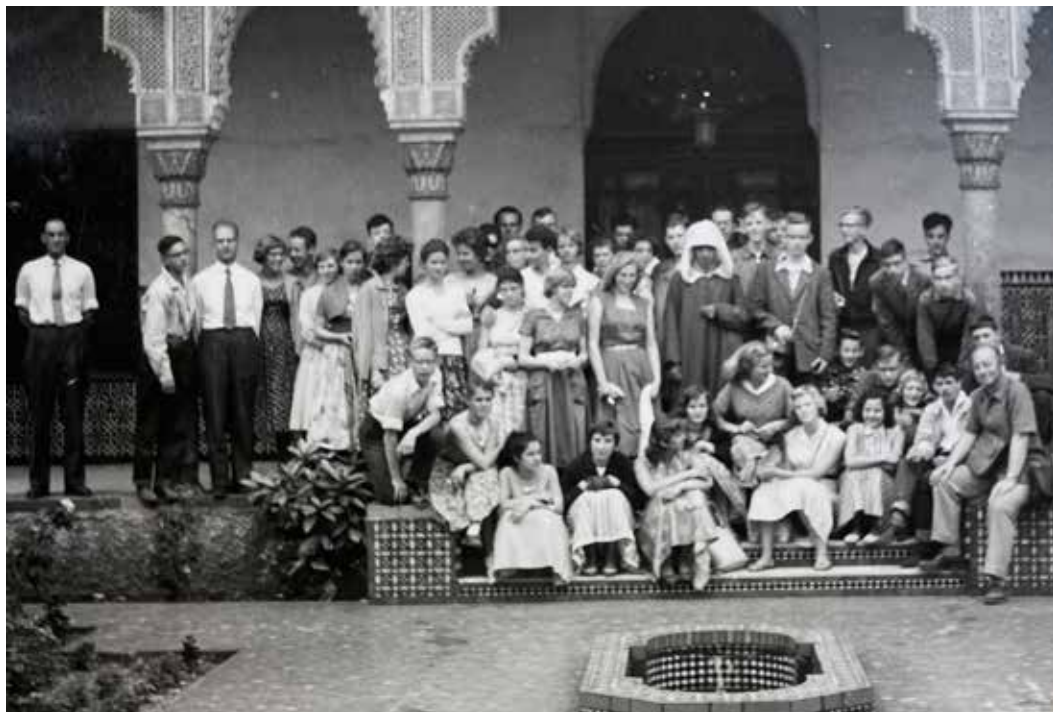
juli 1958, klas 4A en 4B bij het "Institut Musulman" in Parijs