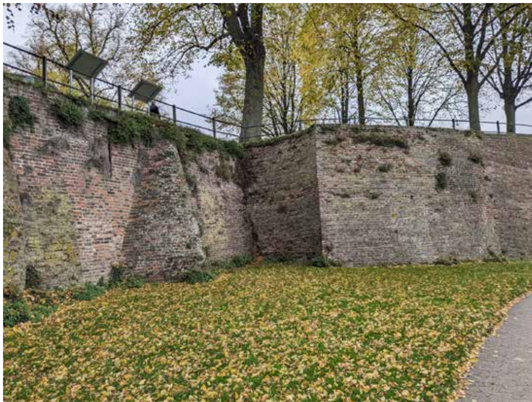
Een stukje van de oude stadsmuur

lagen de Delltor en de Falltor. En uiteraard gold nog steeds dat de graven tegen overstroming beschermd moesten worden.