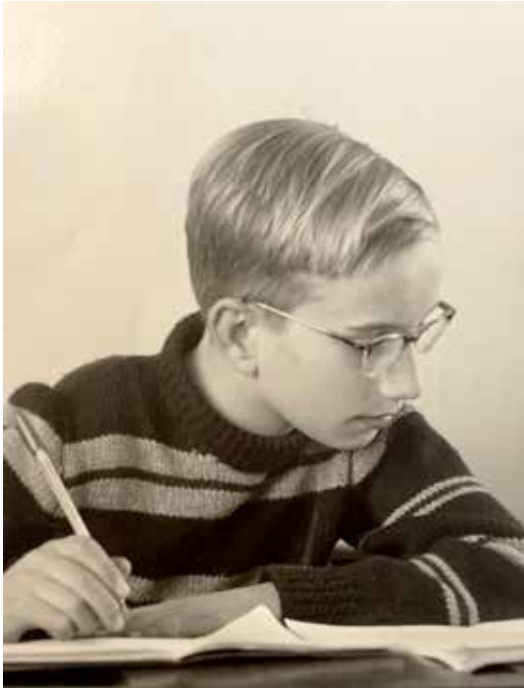
in klas 2B

In september 1954 kwam ik aan op het Haganum, in klas 1 B. Op dat moment omvatte het Koninkrijk der Nederlanden nog net ook nog enige overzeese gebiedsdelen: Nieuw-Guinea, Suriname en de Nederlandse Antillen. De onderhandelingen over een meer gelijkwaardige relatie met Suriname en met de Antillen waren zo goed als klaar. In december 1954 kwam daartoe het Statuut van het Koninkrijk der Nederlanden gereed, en op 29 december bekwam dit rechtskracht.