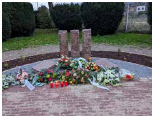
Dubbelmonument voor de omgekomen Nederlandse dwangarbeiders en de vermoorde Joodse inwoners. De foto is genomen op de dag na de herdenking die daar altijd is op 9 november (Kristallnacht).